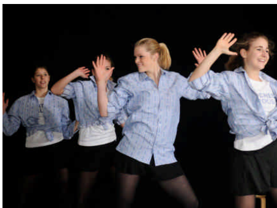
Die Contradiction Dancers in Action

Die Tanzgruppe der Rhythmischen Gymnastik Ittigen, fasziniert alle mit ihrer Show im Edelweisslook. Die peppige Kombination aus Tanz, Akrobatik und rhythmischer Gymnastik dauert 15 bis 30 Minuten.