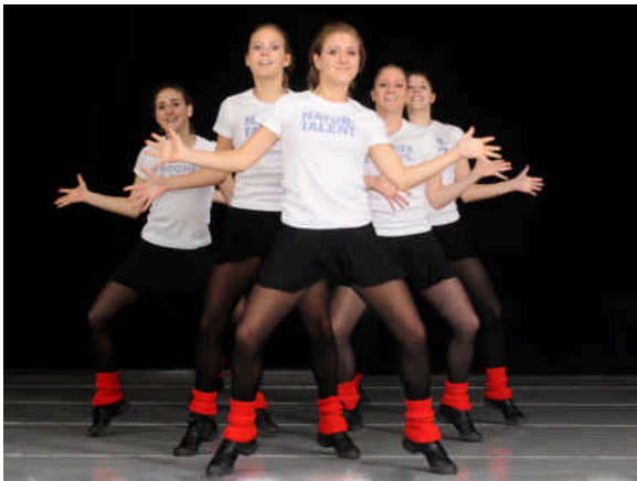
Sie bringen Stimmung in jede Veranstaltung.