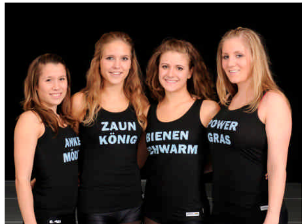
Tänzerinnen mit individuellen Shirts.